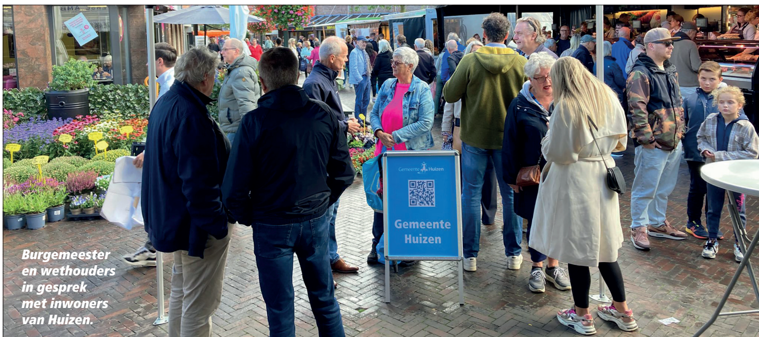
Burgemeester en wethouders in gesprek met inwoners van Huizen.

Het college van burgemeester en wethouders heeft de begroting 2025 van de gemeente Huizen vastgesteld. In de begroting staat aan welke zaken de gemeente in 2025 geld gaat uitgeven en hoeveel. Op donderdag 7 november 2024 behandelt de gemeenteraad de begroting en de belastingvoorstellen.